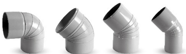
اتصالات فاضلابی چسبی - زانو