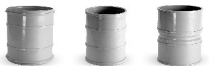
اتصالات فاضلابی چسبی - سوکت