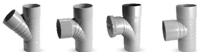
اتصالات فاضلابی چسبی- سه راهی تبدیل