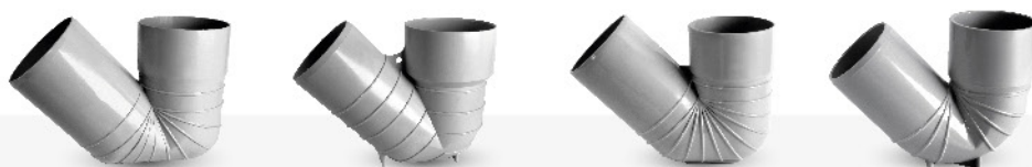
اتصالات فاضلابی چسبی - سیفون