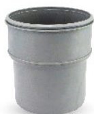
رابط نرو ماده