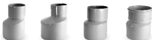
اتصالات فاضلابی چسبی - تبدیل